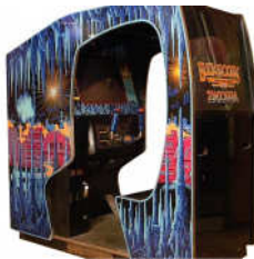
Buck Rogers – Planet of Zoom